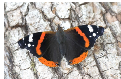
Unverkennbar: der Admiral ( Vanessa atalanta)