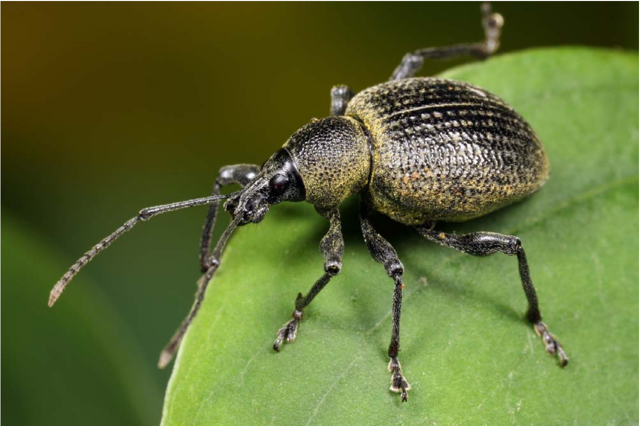
Abb. 6: Otiorynchus salicicola HEYDEN, 1908, eine Dickmaulrüsselkäferart, die erst seit einigen Jahren in Deutschland nachgewiesen wird