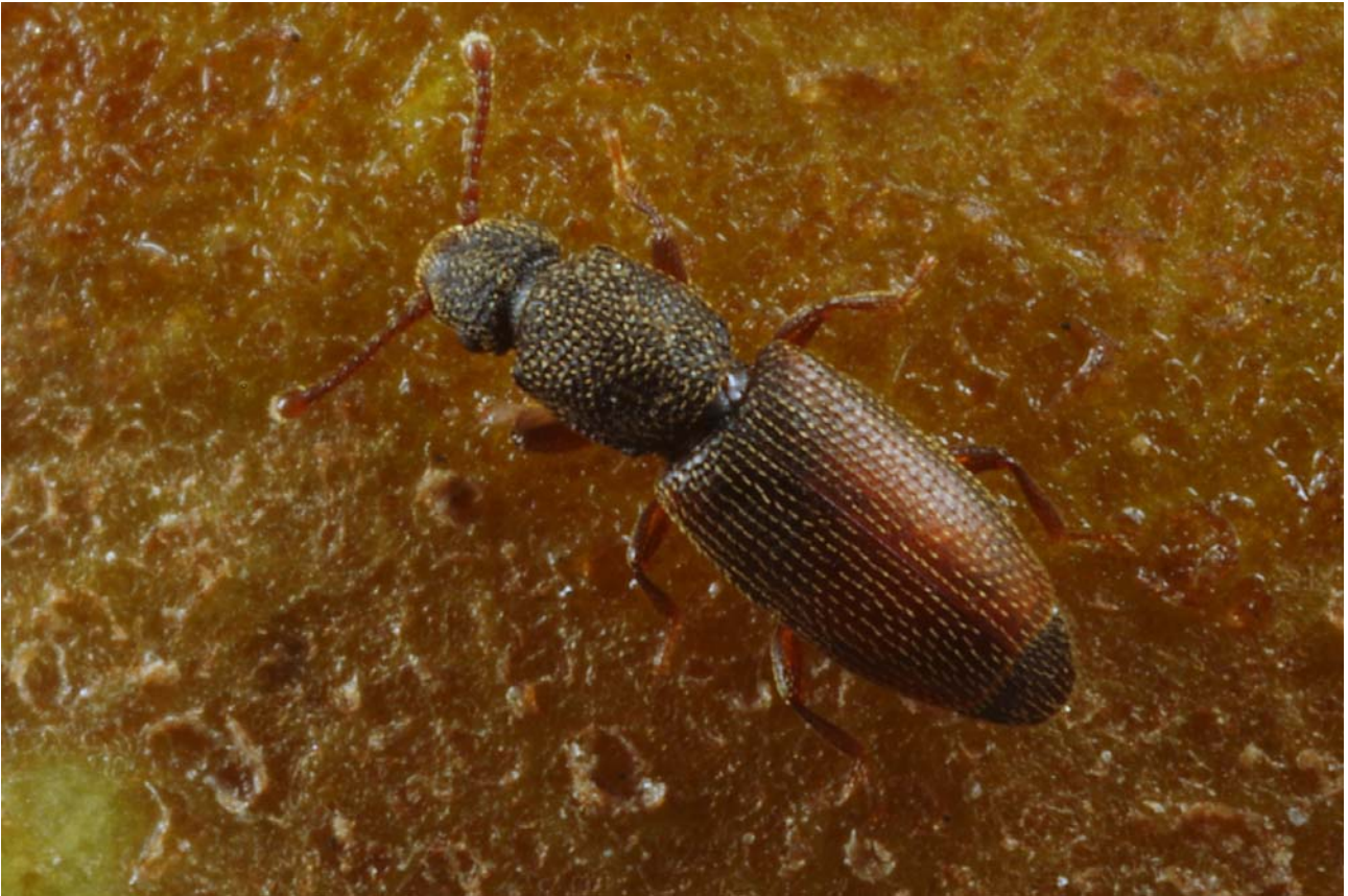
Abb. 3: Monotoma bicolor VILLA, 1835, die der bislang unerkannten M. quadricollis AUBÉ, 1837 sehr ähnlich sehende Rindenglanzkäferart