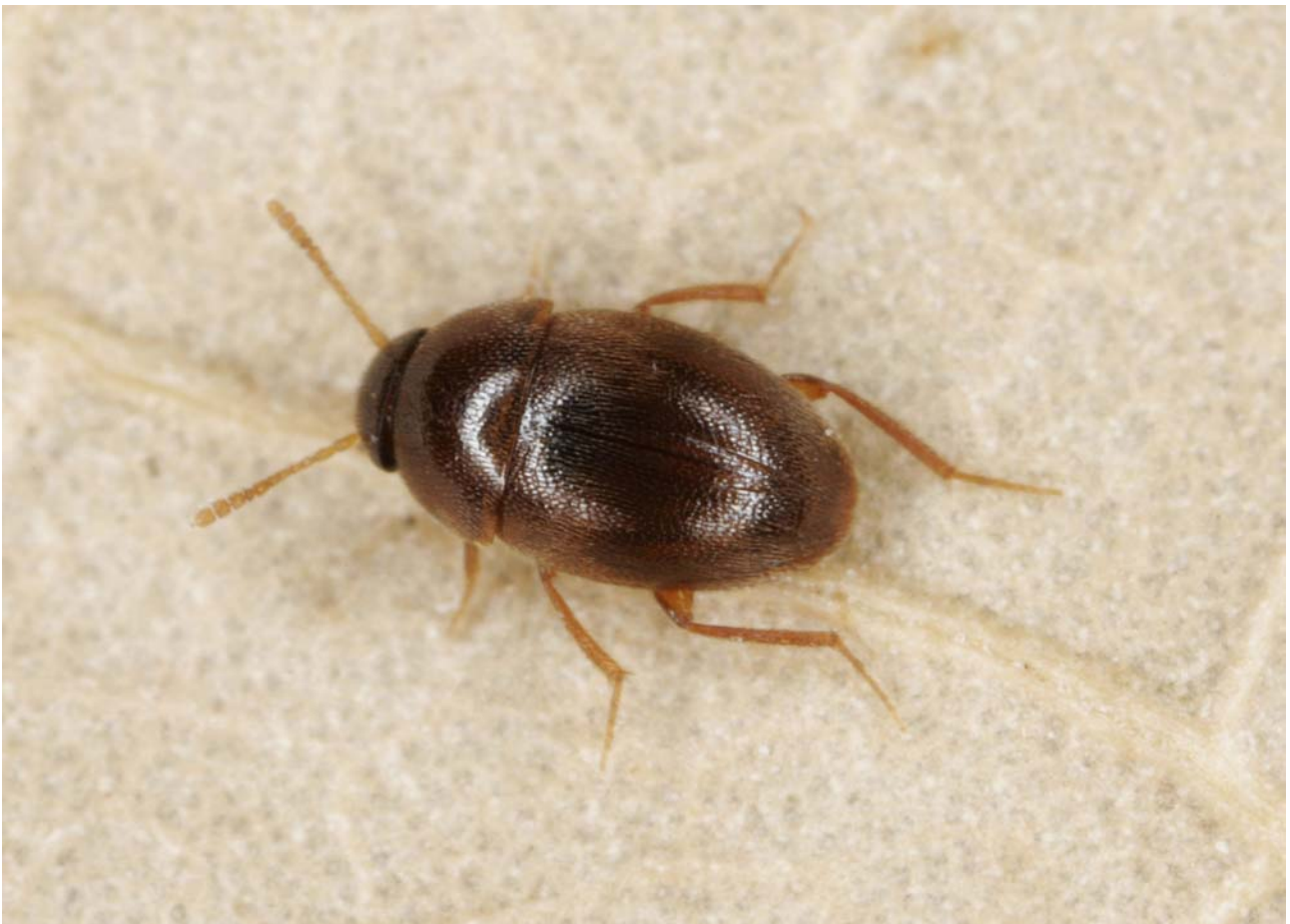
Abb. 1: Nargus anisotomoides (SPENCE, 1815), Foto: Christoph Benisch ( www.kerbtier.de )

Nun gelang im Süden des Landes, im Grenzbereich zwischen Nieder- und Oberlausitz, die Entdeckung eines neuen Vorkommens von Nargus anisotomoides und damit die Bestätigung der Existenz der Art in Brandenburg: Ortrand, Kmehlener Berge, 14.11.2009, leg. Esser (18 Ex.) und leg. Kielhorn (8 Ex.). Die vom Autor gesammelten Tiere wurden aus Wurzelnischen und Reisig zwischen Stockausschlägen von Ulmus gesiebt. Die vom Kollegen K.-H. Kielhorn gesammelten Exemplare entstammten einem Gesiebe aus Fichtenstreu.