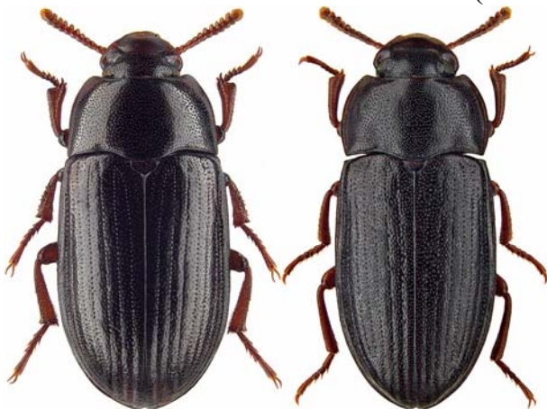
Abb. 4: Alphitobius diaperinus (PANZER, 1797) (links), Alphitobius laevigatus (FABRICIUS, 1781) (rechts)

(i) → (+) Im Krokodilhaus des Berliner Tierparks gelang K.-H. Kielhorn der Nachweis dieser Schwarzkäferart (20.02.2010, 6 Ex.). Damit ist nicht nur ein neuer